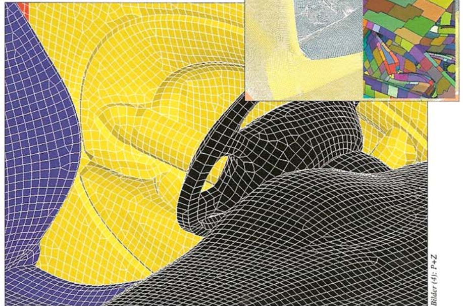
Geometrie mit rund 195 000 Elementen und Patch-Informationen

Typischerweise stehen in der Konzeptphase nur unvollständige Geometrie-Informationen zur Verfügung. Im neuen CAE-Programm lassen sich mit Hilfe von einfachen parametrischen Modellen die Konzepte auf ihre Performance hin überprüfen und optimieren. In der anschließenden Serienentwicklung, mit zunehmend genaueren Geometrieinformationen, liefert die Software durch die Kopp-